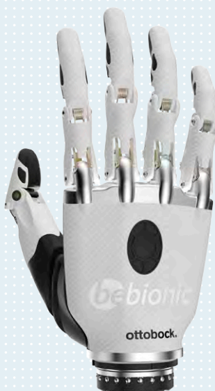
▶ small, bianca