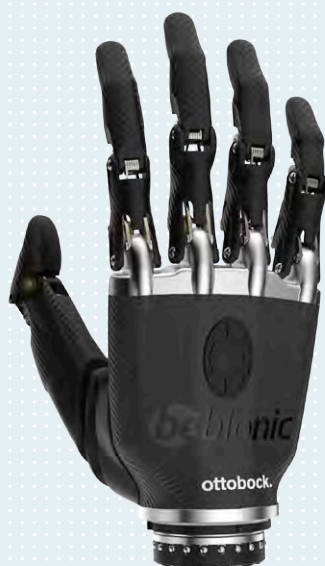
▶ small, nera