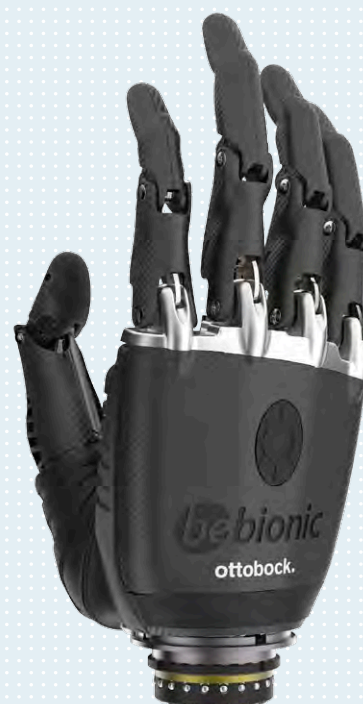
▶ medium, nera